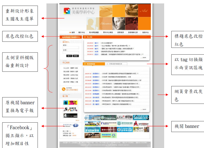
已完成的新美術學科中心首頁版型

五、美術學科中心建置網站討論平台，為增進學科中心點閱及使用率，已經開始從網路平臺之資訊開放性以及視覺美觀親和性著手將網站之版面改進設計，並已完成學科中心新網站版型如下，並持續強化美術學科中心網站資訊流動性。